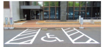
車いす使用者用駐車施設