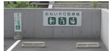
おもいやり駐車区画

公共施設や商業施設(ショッピングセンターなど)に設置されている右の写真の様な駐車区画での利用が可能です。駐車するときは、ルームミラーに利用証を掛けるなど、車外から見えるように掲示してください。