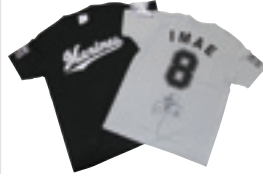
サイン入りTシャツ M・Lサイズ 各1名様

〔応募方法〕左の封書をご利用いただくか、お手持ちのハガキに左誌面の質問項目を必ず記載し、千葉県医師会「今江敏晃さん読者プレゼント係」までお送りください。