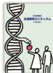
生涯教育カリキュラム(2009)