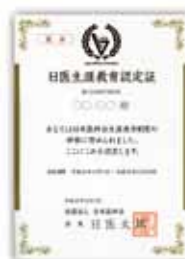
日医生涯教育認定証